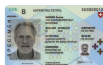
Autorisation de séjour Copie recto verso

Veillez envoyer la copie d'une pièce d'identité avec la demande à: Cornèr Banque SA Succursale BonusCard (Zurich) Case postale 8021 Zurich