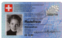
Carte d'identité Copie recto verso