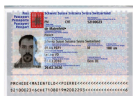
Passeport Copie de la page avec votre photo et votre signature