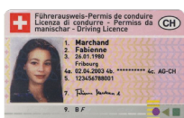
Permis de conduire Copie recto