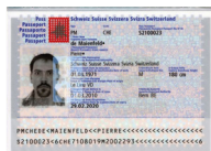
Pass Kopie der Seite mit Ihrem Bild und der Unterschrift