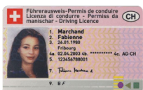
Führerausweis Kopie der Vorderseite