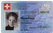
Identitätskarte Kopie der Vorder- und Rückseite