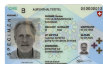
Aufenthaltsbewilligung Kopie der Vorder- und Rückseite

Bitte senden Sie die Ausweiskopie zusammen mit dem Antrag an: Cornèr Bank AG Zweigniederlassung BonusCard (Zürich) Postfach 8021 Zürich